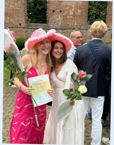
FOTO IMPRESSIE DIPLOMA-UITREIKINGEN